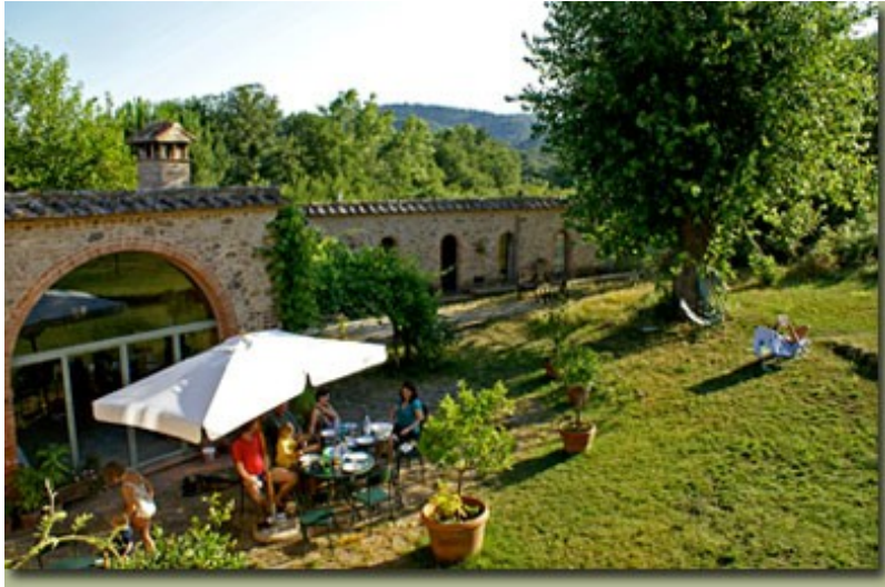
Seminarort Campalfi /Toskana www.campalfi.de