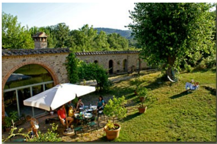
Seminarort Campalfi /Toskana www.campalfi.de